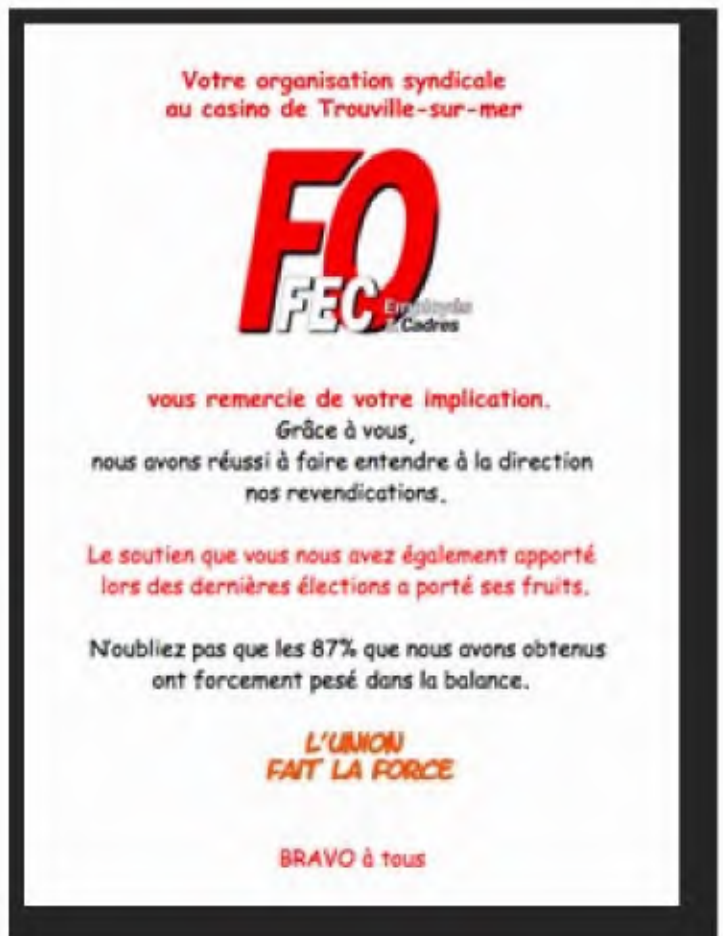
Céline GRANDJEAN Déléguée syndicale du Casino de Trouville